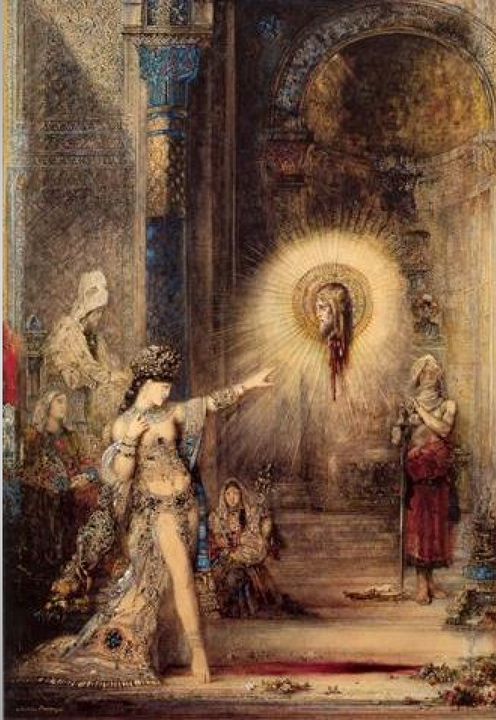
☐ • ◻ ◻ ◻ // // ✓ ✕ • ▲ • // ● Gustave Moreau 1876 Watercolor 105x72 cm Musée du Louvre, Paris