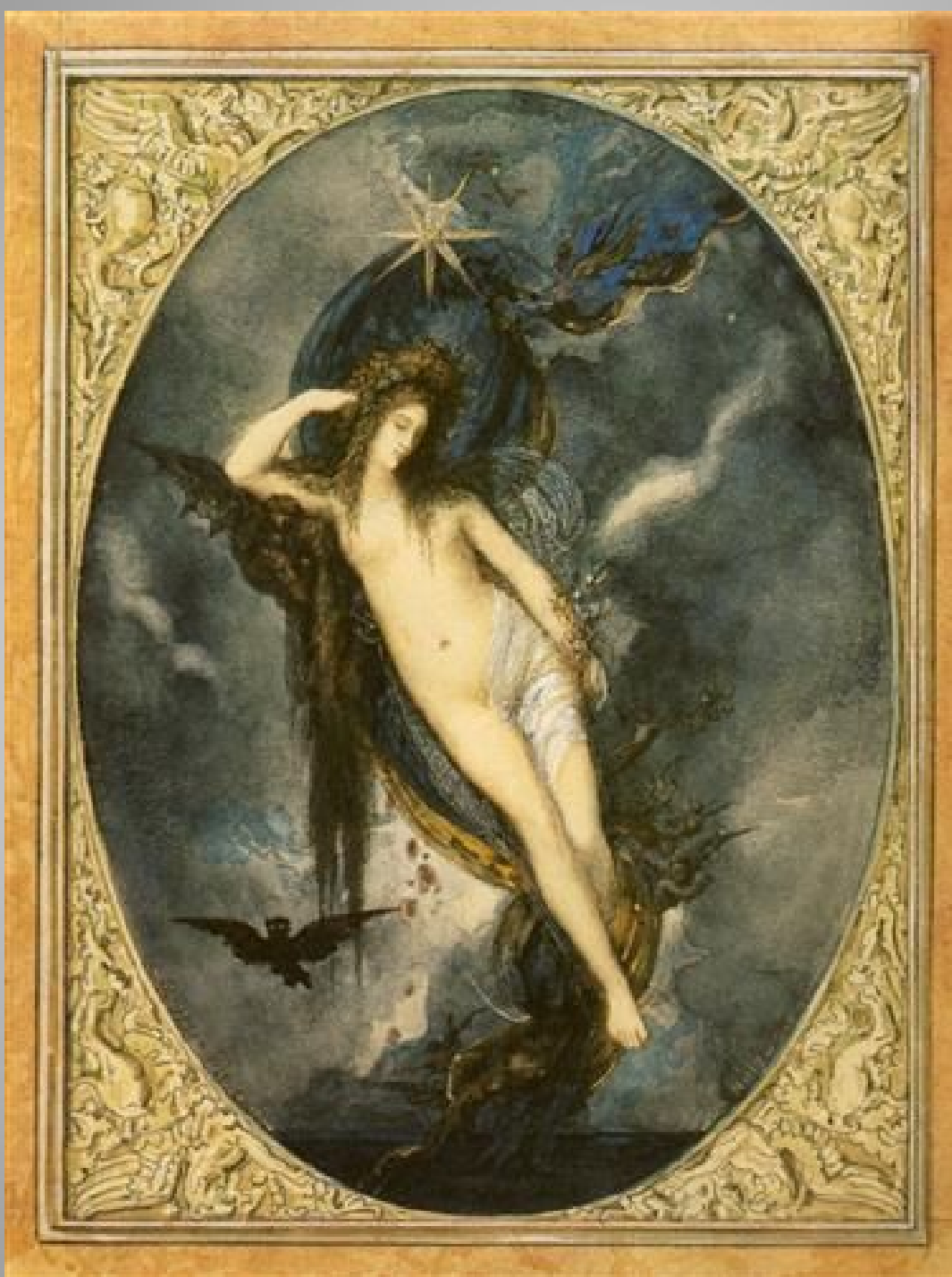
Gustave Moreau Night, c.1880 Symbolism allegorical painting gouache, watercolor Pushkin Museum of Fine Art, Moscow, Russia