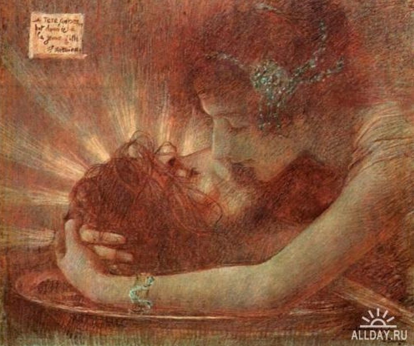
Salome Painting By Gustave Moreau