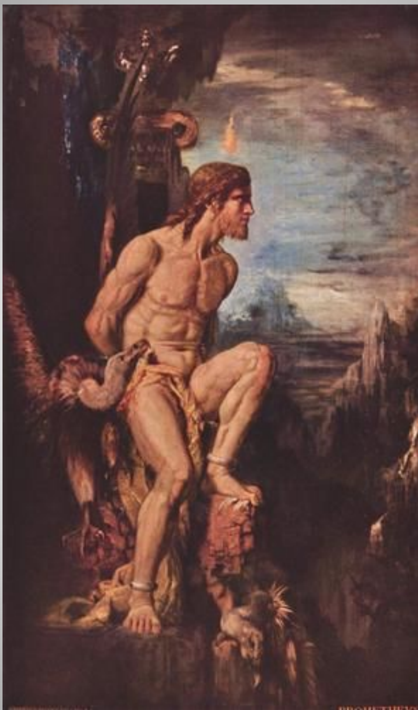
Gustave Moreau 1868 Prometheus Symbolism mythological painting 51.5 x 87 cm oil, watercolor on canvas Private Collection