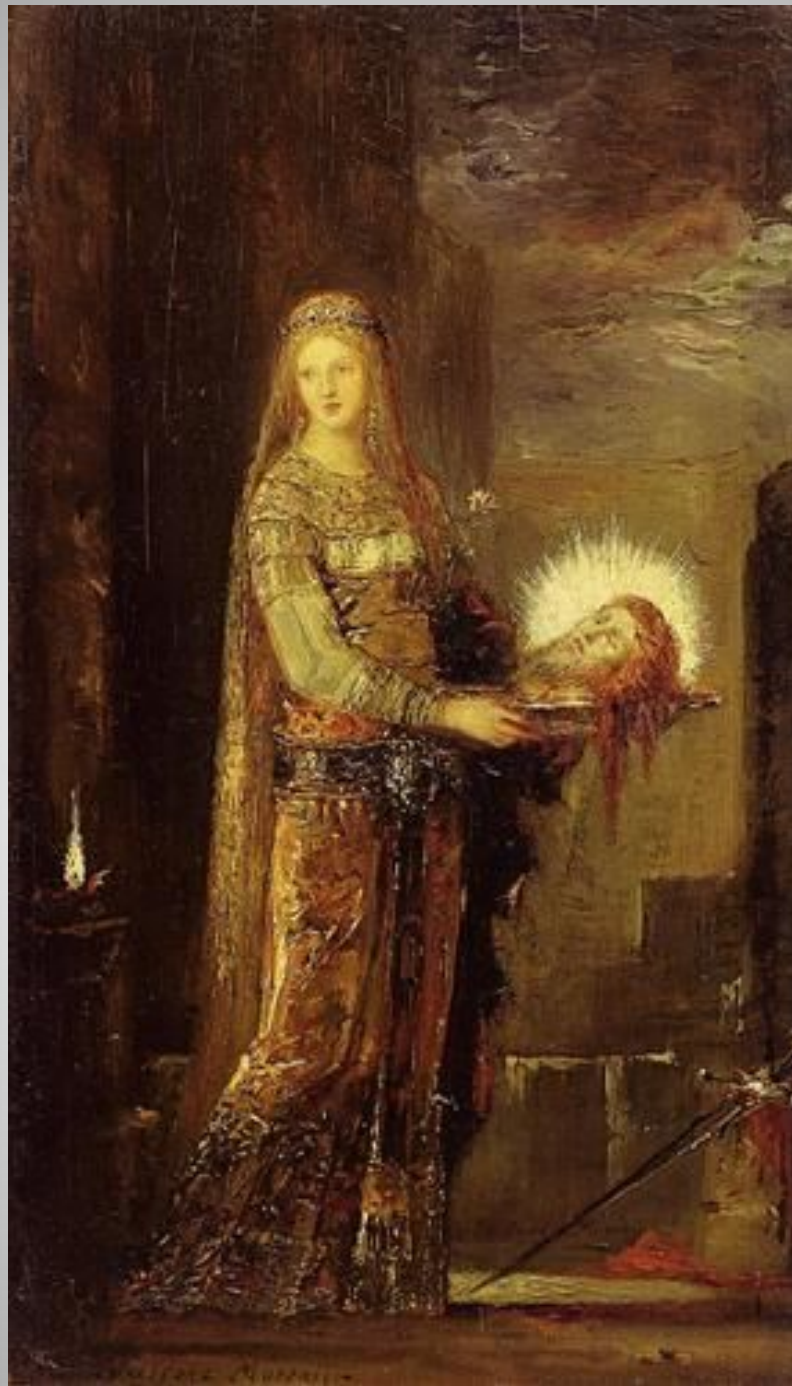
Gustave Moreau Salome Carrying the Head of John the Baptist on a Platter. 1876 Symbolism religious painting Oil on board Private Collection