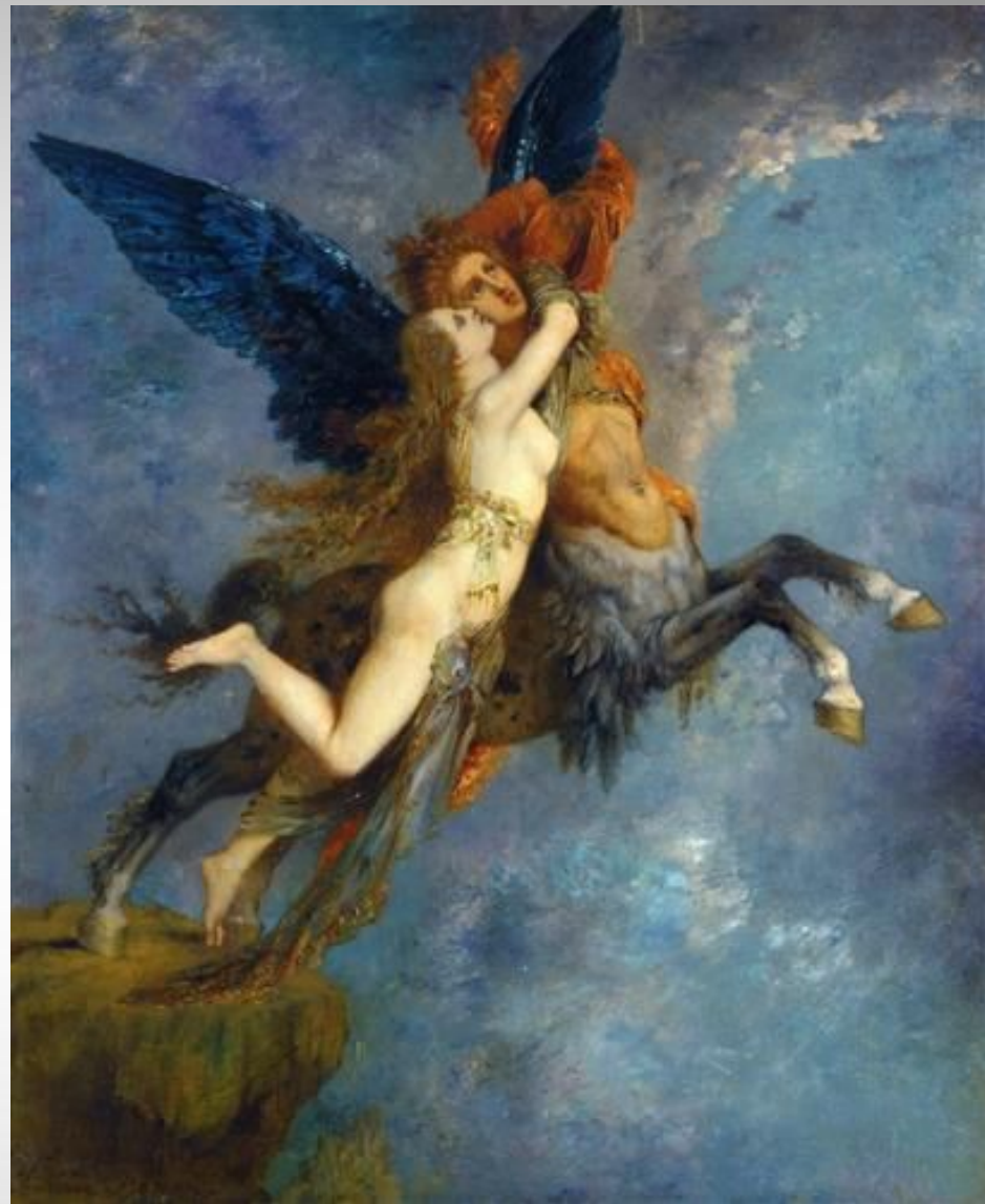
Gustave Moreau 1867 Symbolism mythological painting oil 27.3 x 33 cm Fogg Art Museum, Cambridge, Massachusetts, USA