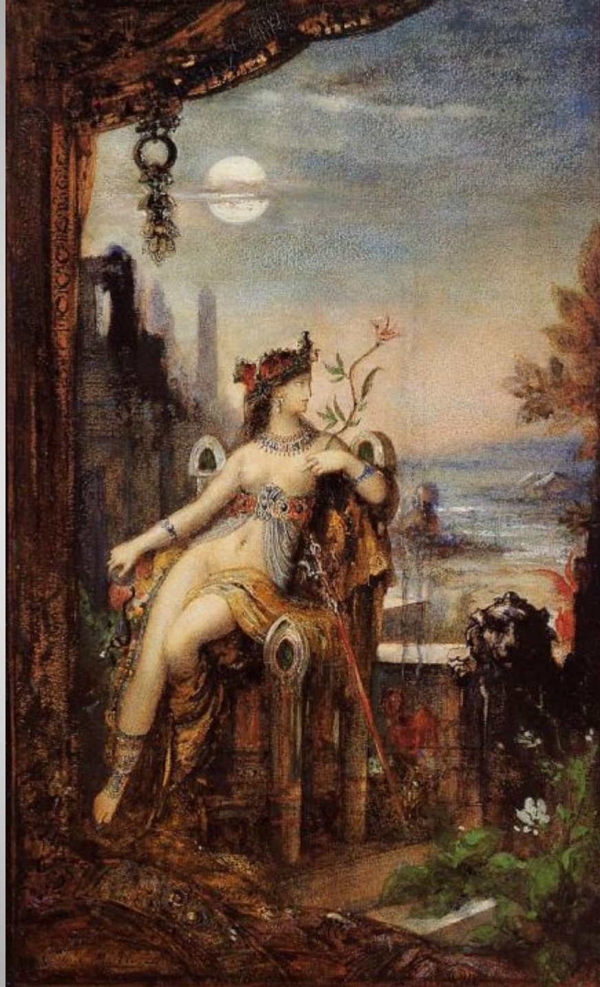
Gustave Moreau Cleoptra c.1887 Portrait watercolor, Black ink, pastel, and oil, 39.5 x 25 cm