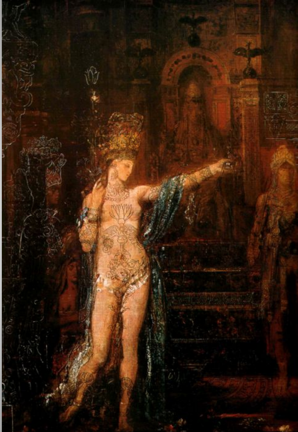
Gustave Moreau Salome dancing before Herod c.1875 Symbolism religious painting oil on canvas 92X61 cm Musée Gustave Moreau, Paris,

שלומית רוקדת לפני הורדוס מצירי המפורסמים של מורו