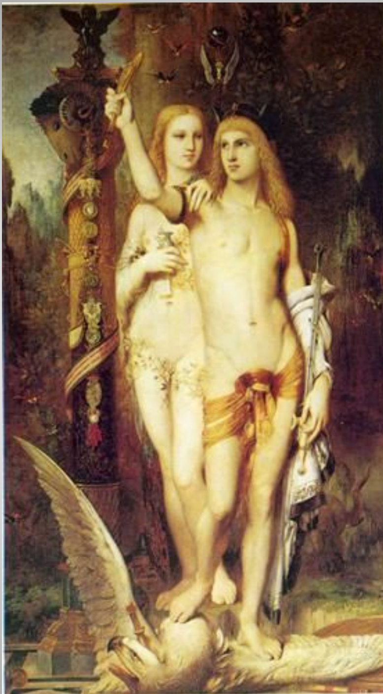
Gustave Moreau Jason 1865 Symbolism mythological painting Oil on canvas 121.5 x 204 cm Musée d'Orsay, Paris,