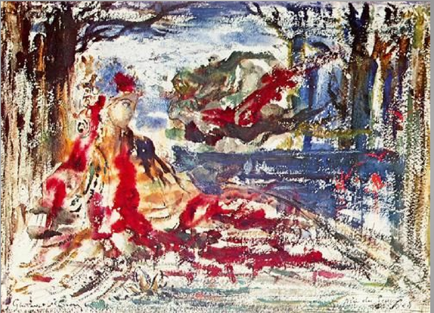
Near the Water 1896 Gustave Moreau Symbolism - sketch and study watercolor Musée Gustave Moreau, Paris