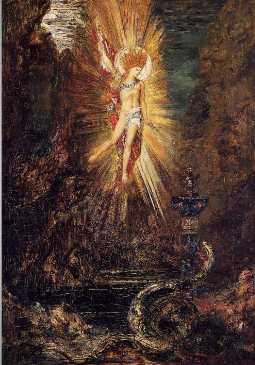
Apollo Vanquishing the Serpent Python 1885

Gustave Moreau Symbolism - mythological painting Oil On canvas National Gallery of Canada, Ottawa, Canada