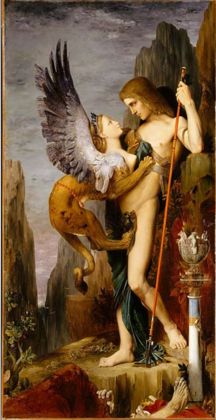
Gustave Moreau French, Paris 1826–1898 Oedipus and the Sphinx 1864 Oil on canvas 206.4 x 104.8 cm