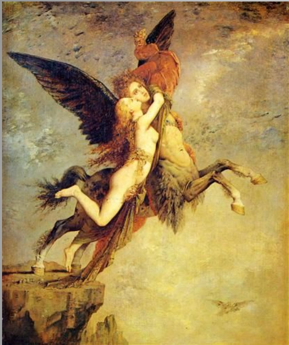
The Chimera - Gustave Moreau Painting - oil on panel 1867 Fogg Museum of Art - Harvard University