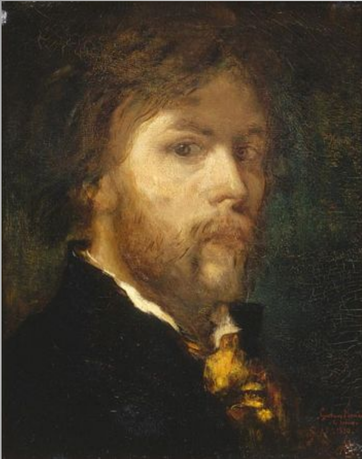
Self-portrait, 1850 41 x 32 cm oil on canvas Musée Gustave Moreau, Paris