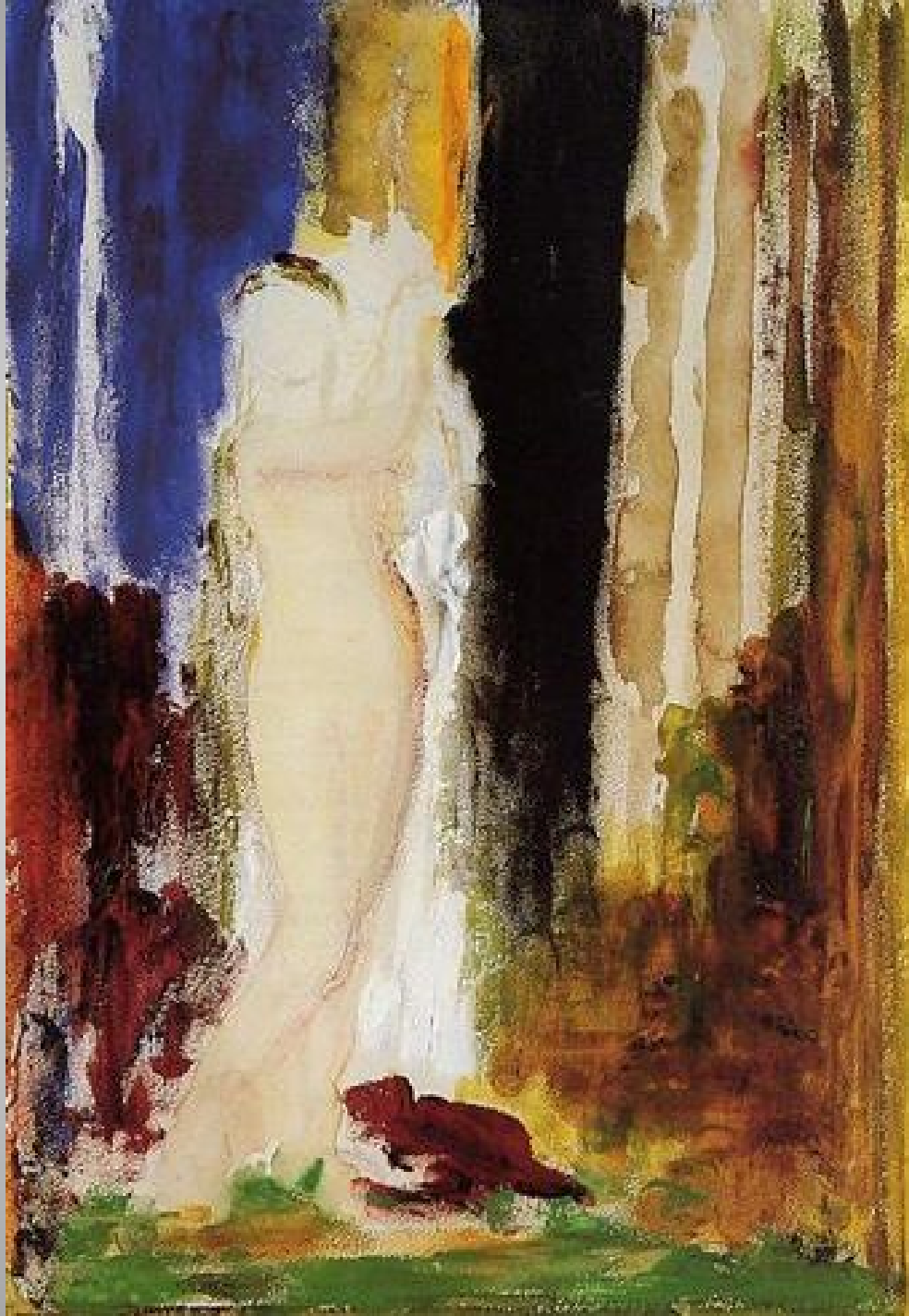
Woman Bathing c. 1890 Gustave Moreau Symbolism - genre painting watercolor Musée Gustave Moreau, Paris, France