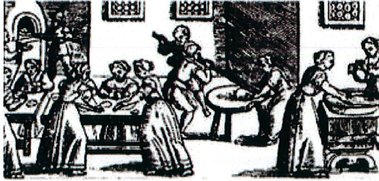
נטילת ידיים מימין והכנת המצות משמאל