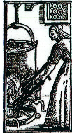
הגעלת הכלים לפסח