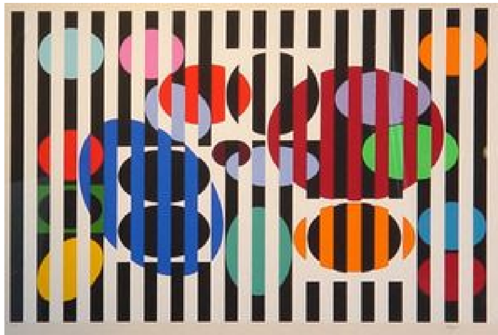
Serigraph 44x72 cm