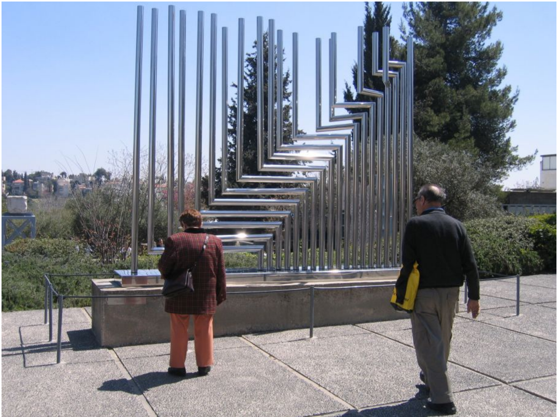
ח"י מעלות, 1971 פלדת אל חלד אוסף מוזיאון ישראל