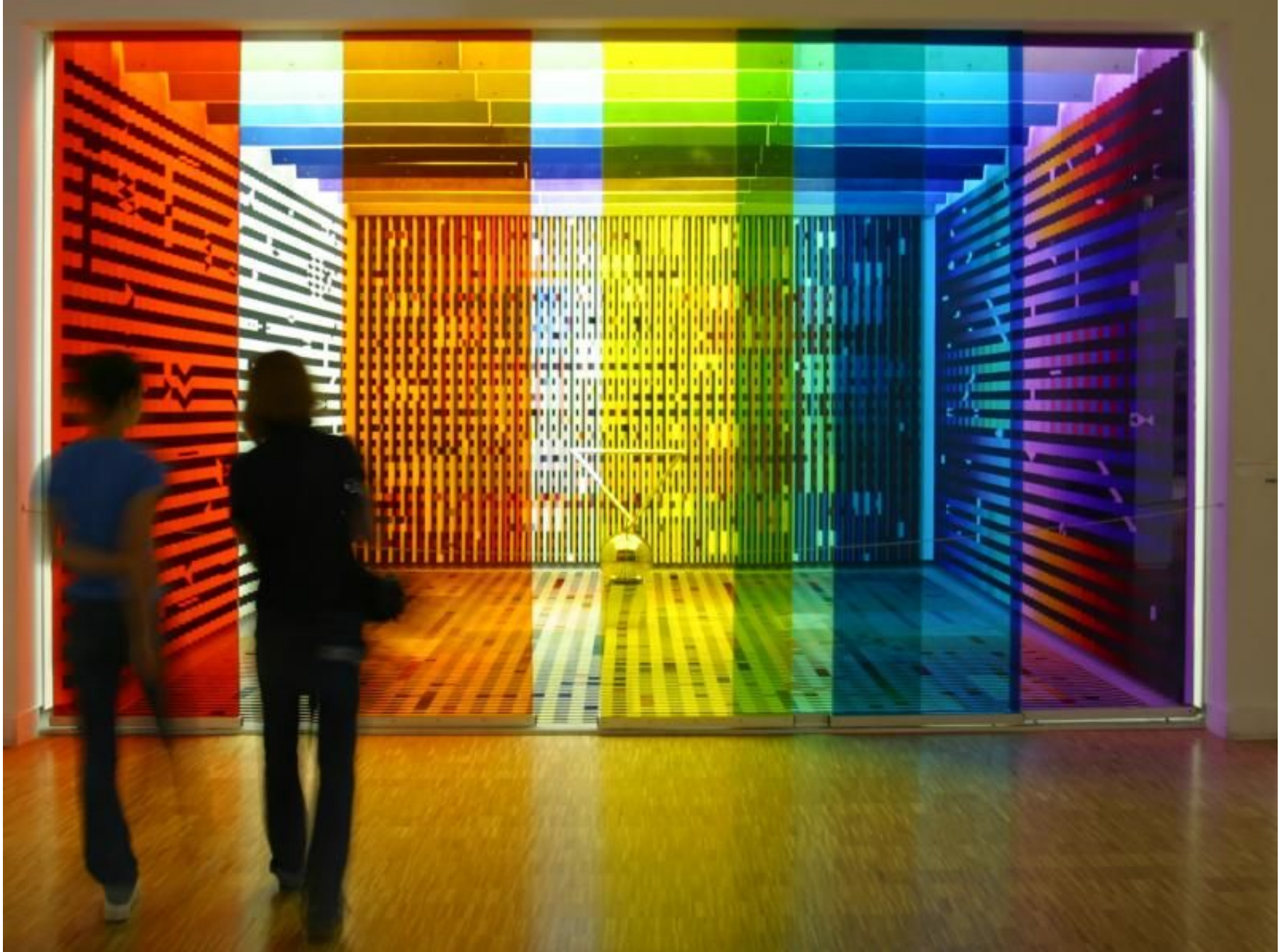
Yaacov Agam, 'Salon de l' Elyse Originally created in 1974 for the Elyse (residence of the French President) Moved in 1983