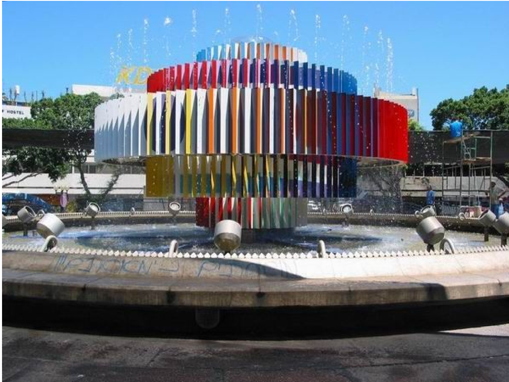
Fountain in Dizengof square