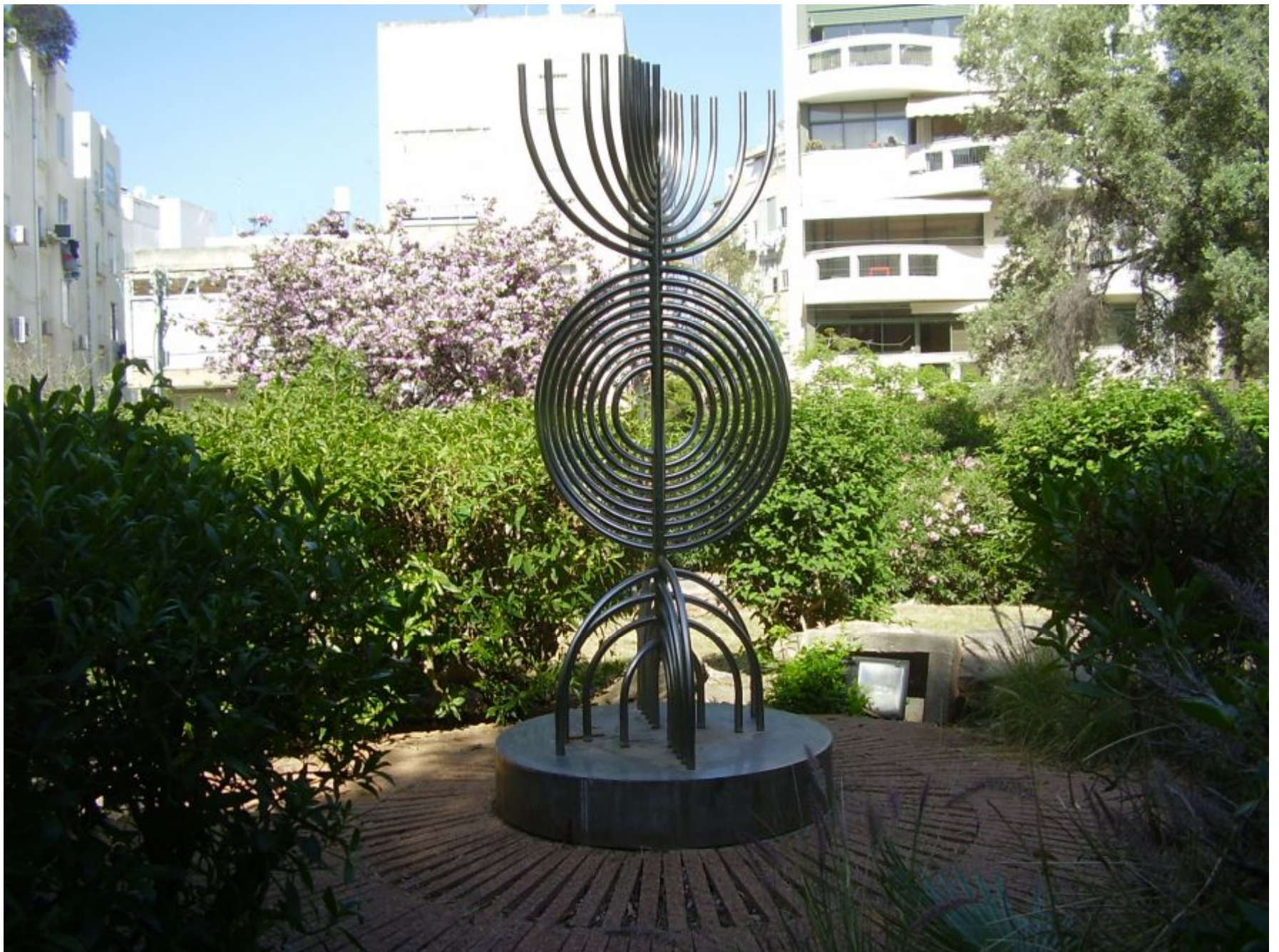
מנורה, 1985 פלדת אל חלד גן ברנדר, תל אביב