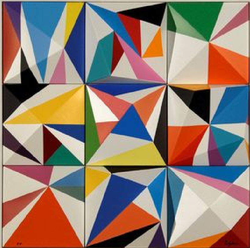
Andromedar II Sculpture-Installation 47.5x47.5x5 cm