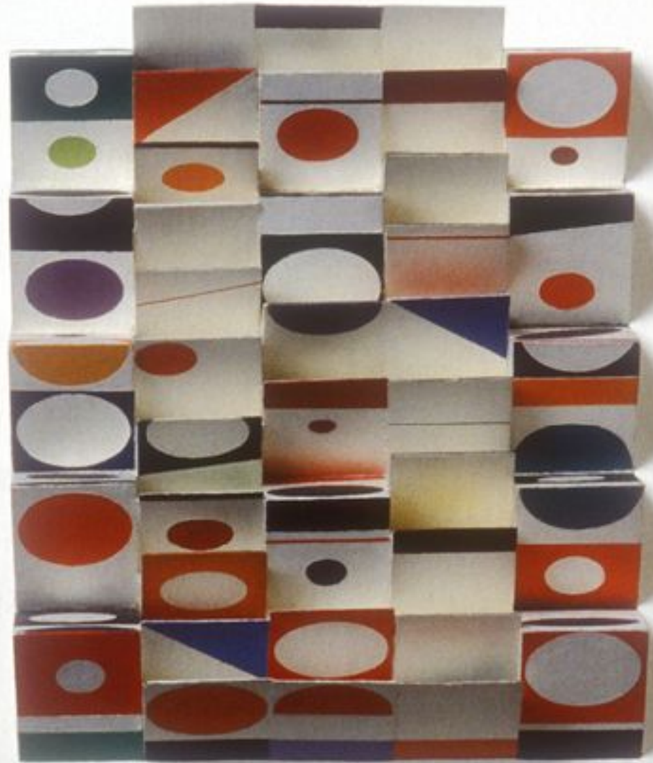
1966 ,Relief Rhythm Yaacov Agam (Israeli, born Palestine, 1928) Painted wood; 42.2 x 48.9 x 9.5 cm