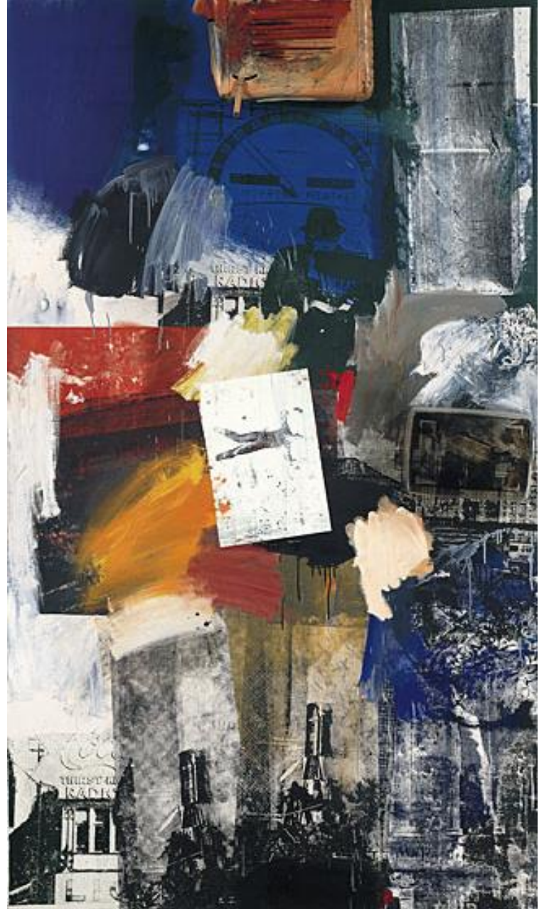
Oil, silkscreened ink, metal, and plastic on .1963 , Untitled canvas, 82 x 48 x 6 1/4 inches. Solomon R. Guggenheim Museum, New York, NY