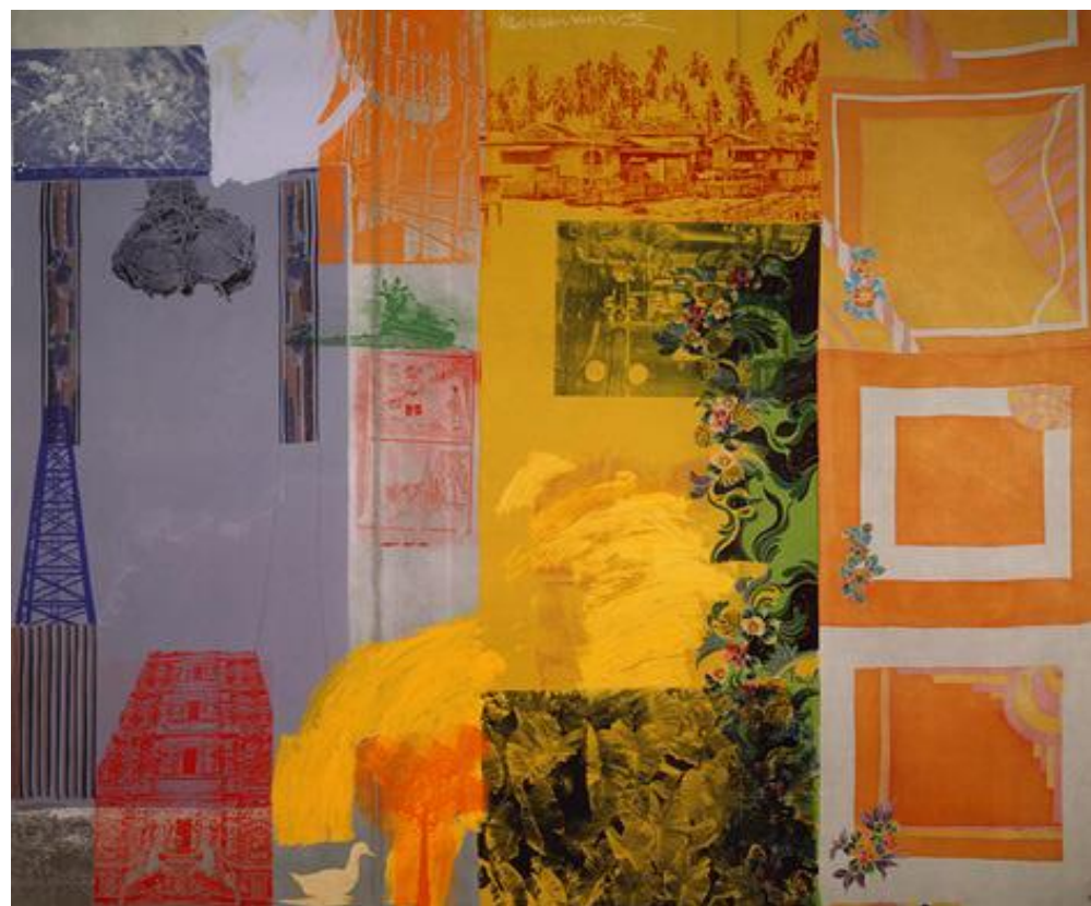
RAUSCHENBERG 1990 Malaysian Flower Cave . acrylic and fabric on galvanized steel, 306.8 x 367.7 cm