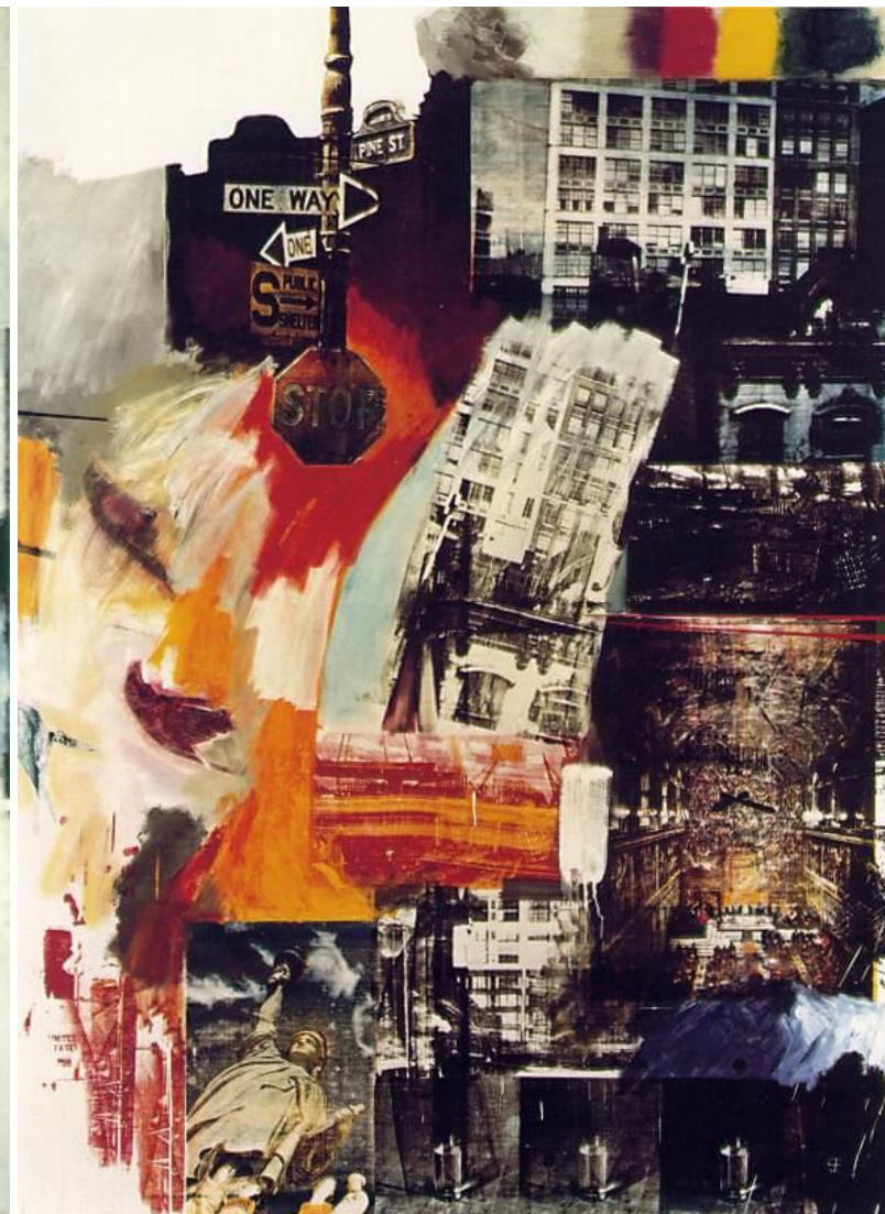
RAUSCHENBERG, Robert Estate 1963 Oil and silkscreen ink on canvas 243.8 x 177.8 cm. Philadelphia Museum of Art