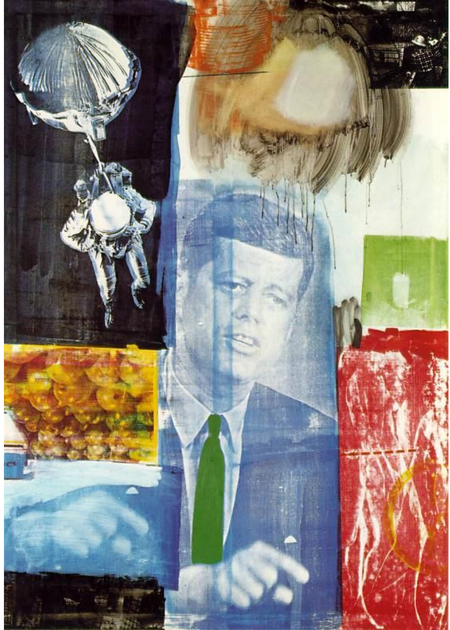
RAUSCHENBERG, Robert Retroactive I 1964 Oil and silkscreen ink on canvas 213.4 x 152.4 cm. Connecticut