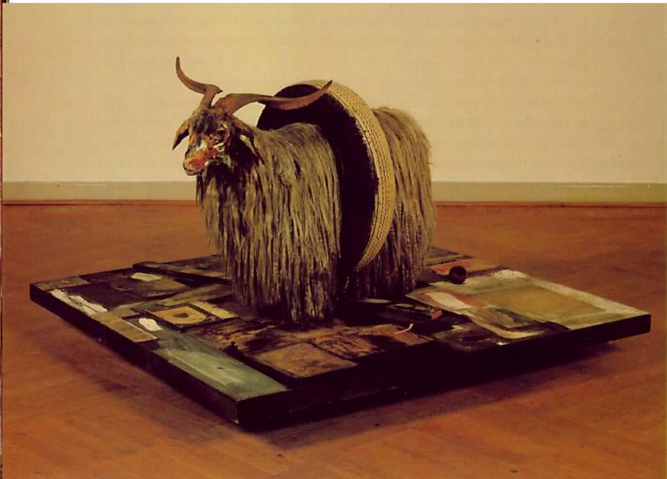
RAUSCHENBERG, Robert Monogram 1955-9 Freestanding combine 105 x 160 x 161.5 cm. Stockholm