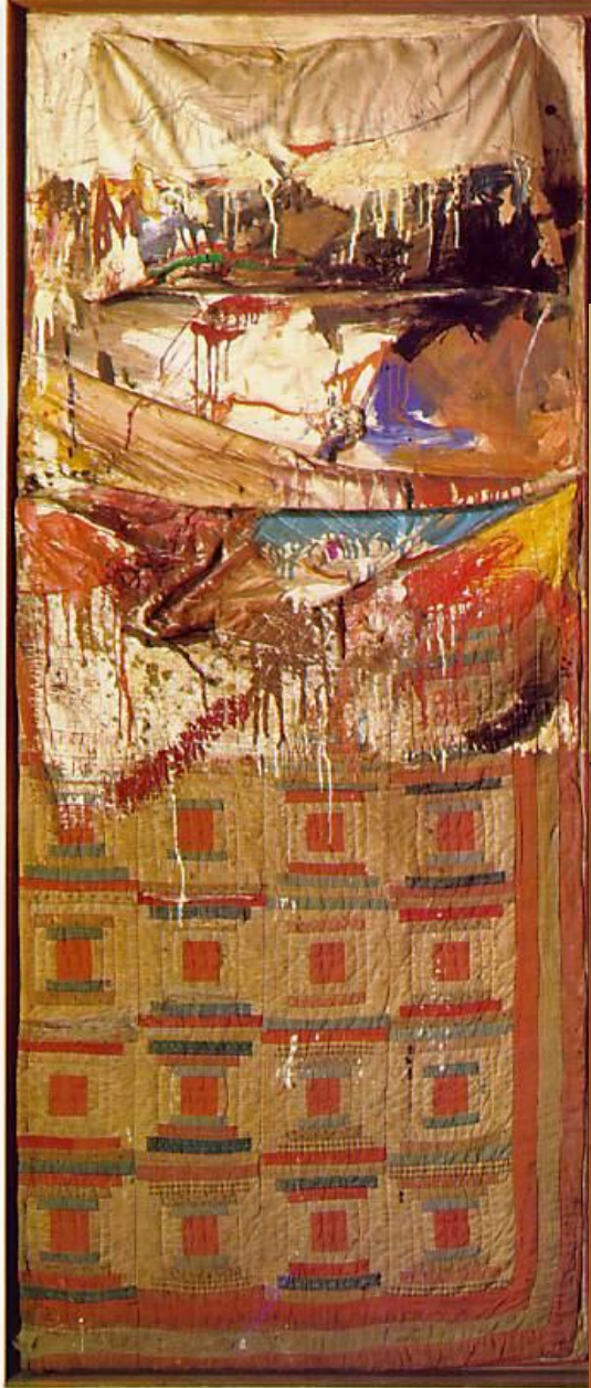
RAUSCHENBERG, Robert Bed 1955 Combine painting 16 x 76 x 15 cm , New York