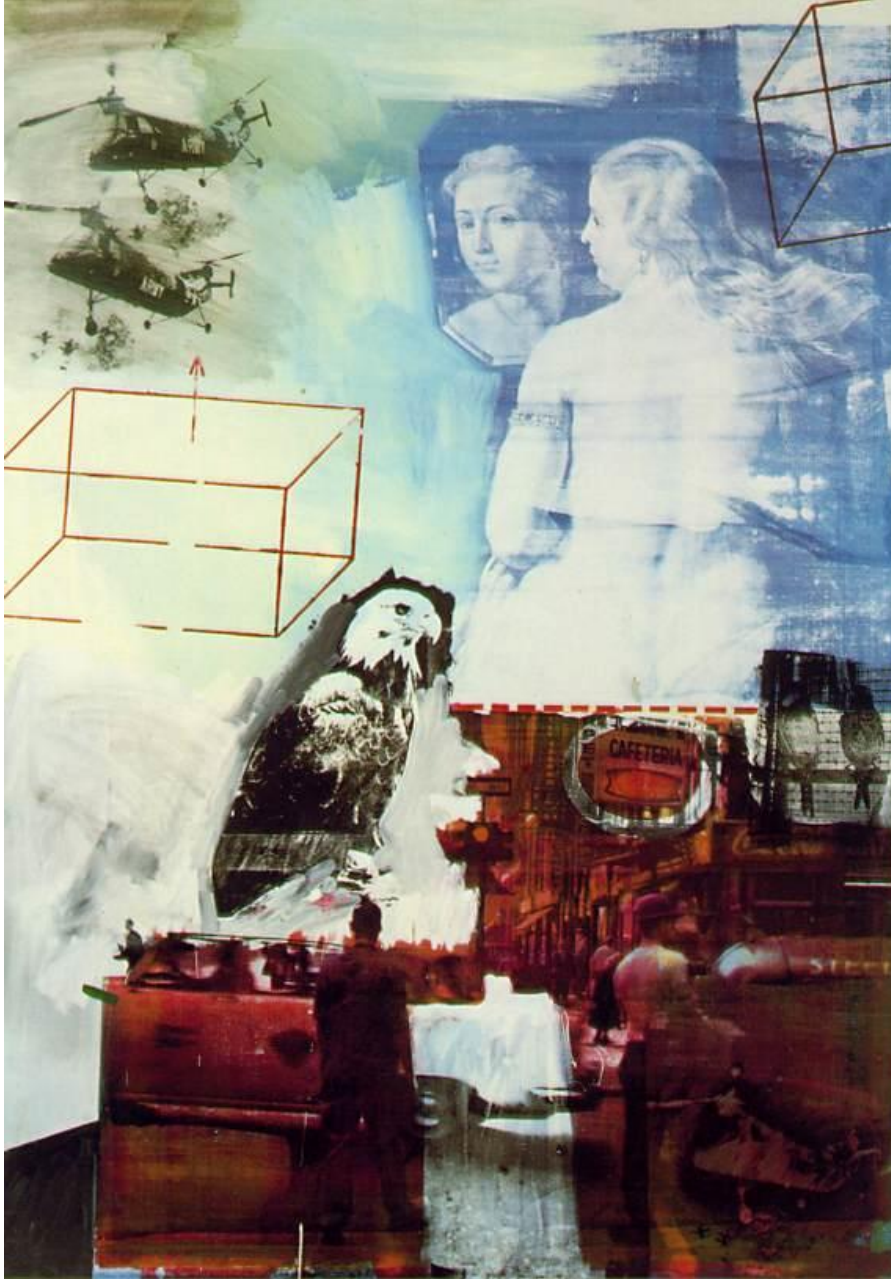
RAUSCHENBERG, Robert Tracer 1963 Oil and silkscreen ink on canvas 213.4 x 152.4 cm. The Nelson-Atkins Museum of Art, Kansas City, Missouri