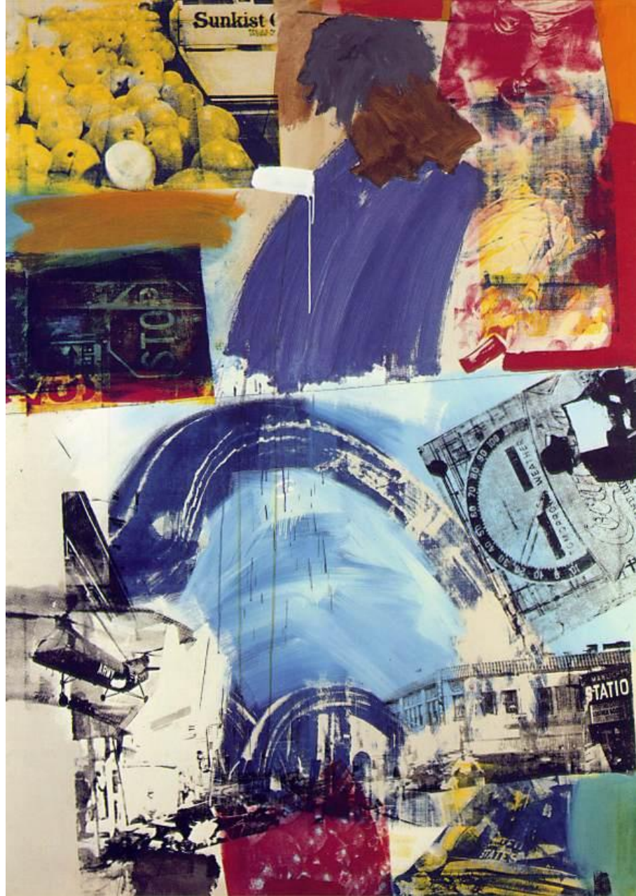
RAUSCHENBERG, Robert Harbor 1964 Oil and silkscreen ink on canvas. 213.4 x 152.4 cm Museum Ludwig, Cologne