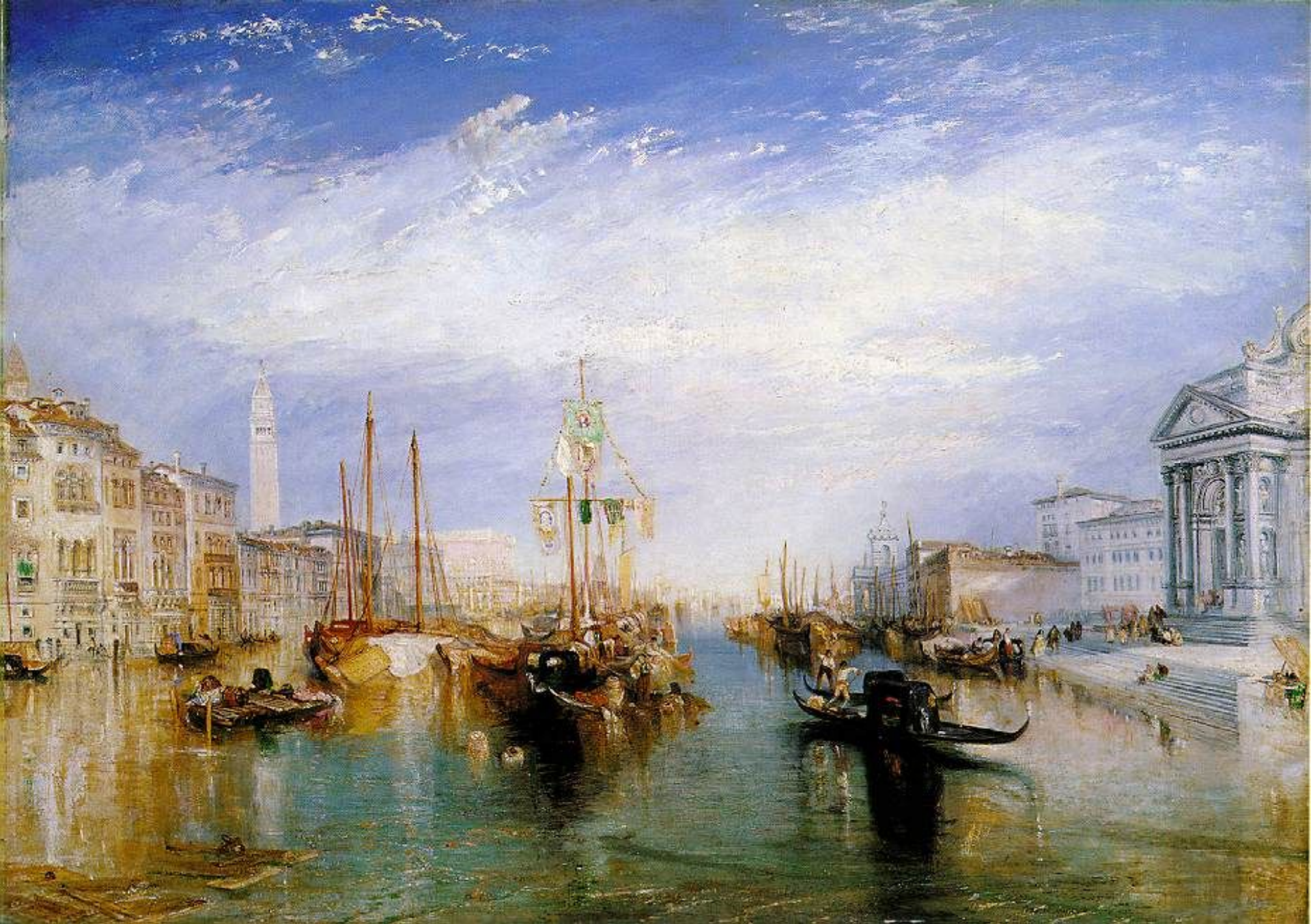
Joseph Mallord William Turner (1775-1851) The Grand Canal, Venice 1835 Oil on canvas (91.4 x 122.2 cm) The Metropolitan Museum of Art, New York