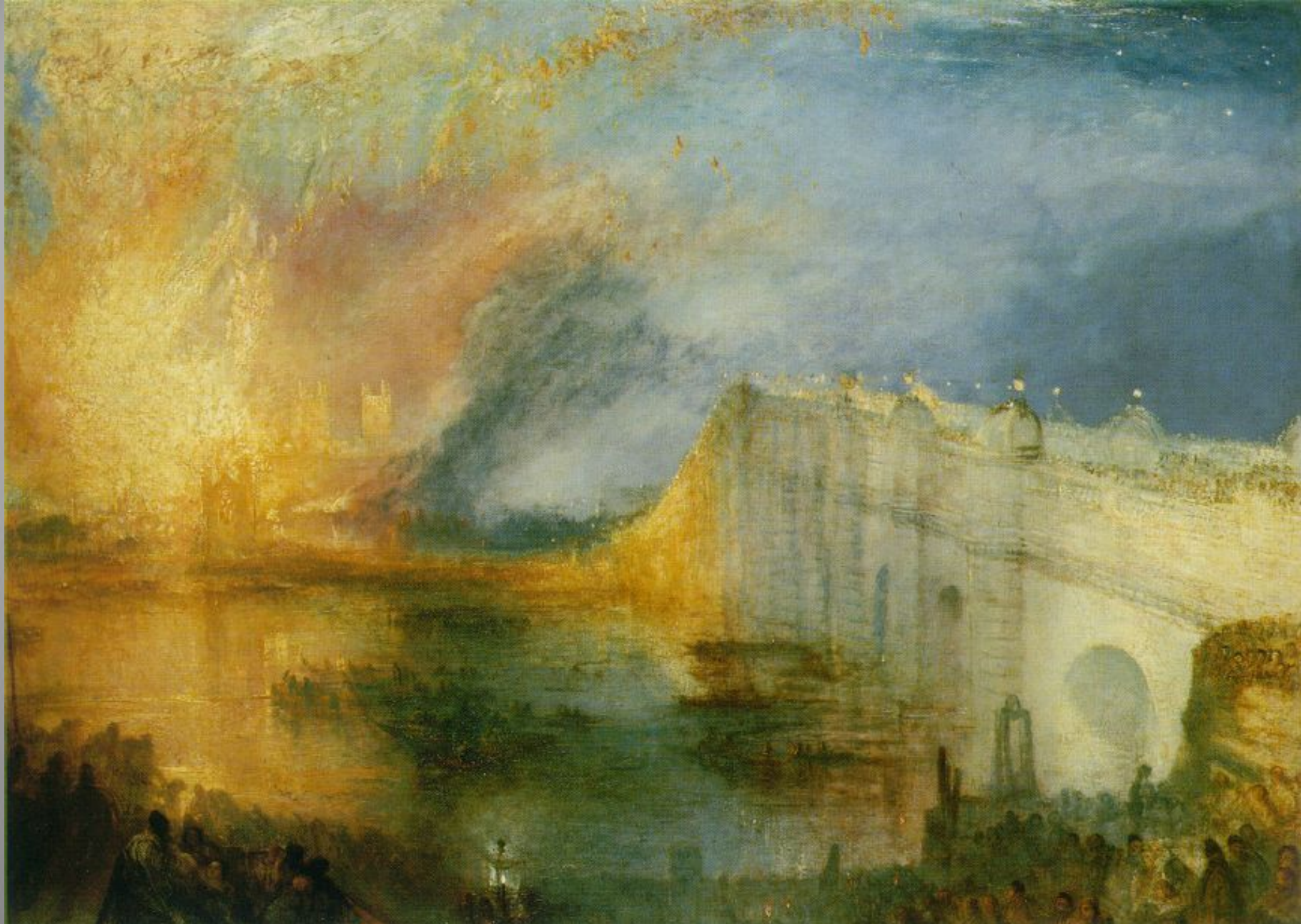
William Turner (1775-1851) The Burning of the Houses of Lords and Commons, 1834 92 x 123 cm Oil on canvas Philadelphia Museum of Art

בשריפת בתי הפרלמנט מתאר טרנר את כוחה המכלה של האש. הדרמה מתרחשת על גדת התמזה ממול לארמון המלוכה. העשן מסתיר את בתי הפרלמנט וגשר אוסטימינסטר מעצים את הדרמה שטרנר ראה במו עיניו. הלהבות המכלות את בתי הפרלמנט וצללית המגדלים ברקע בגווני אדומים כתומים המשתקפים גם בנהר. הגשר הלבן שעשן שחור מבליט אותו והאש אוחזת בשוליו היורדים לגדה הבוהרת יוצר ניגוד כמעין אי של יציבות.