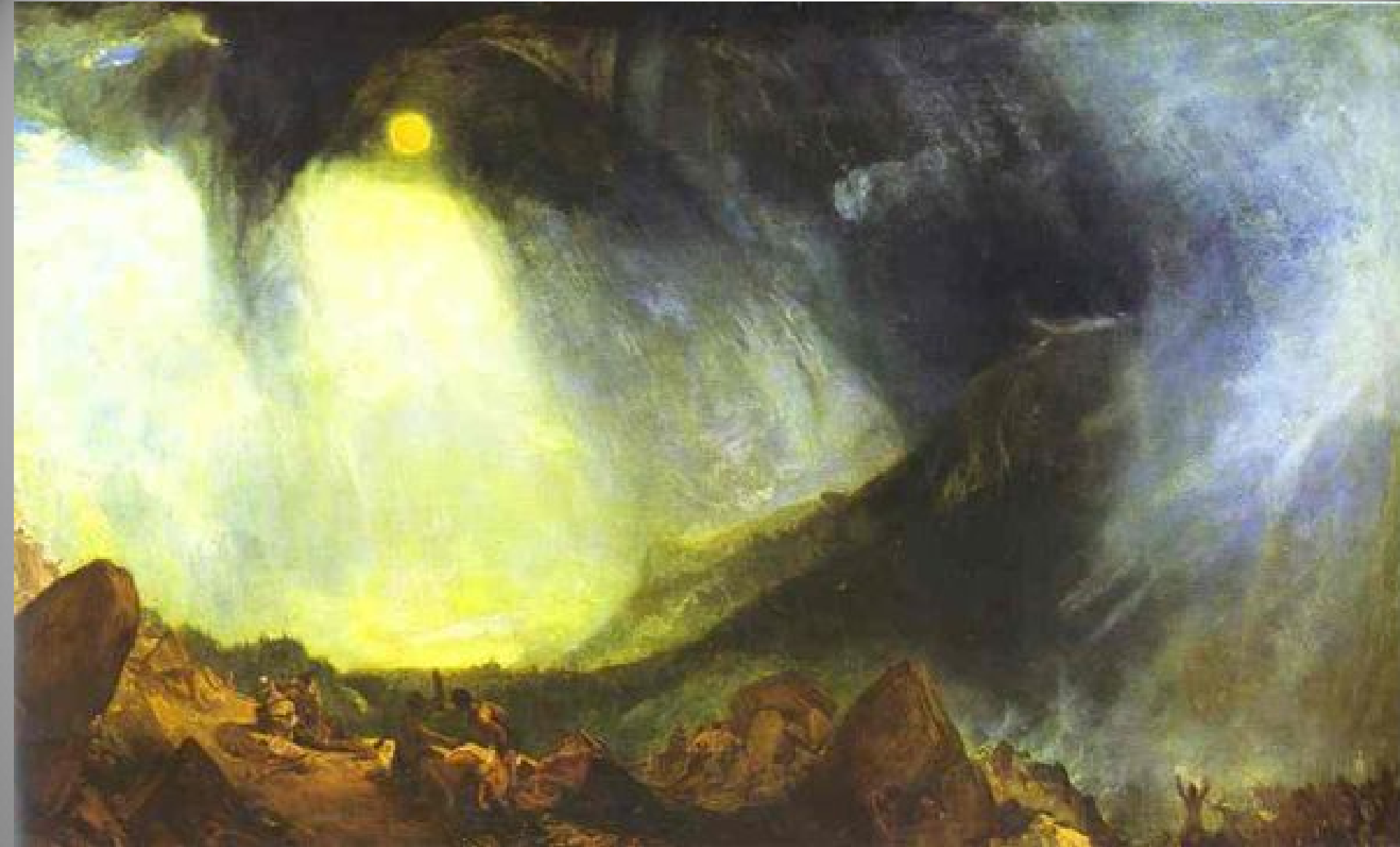
William Turner. Snow Storm: Hannibal and His Army Crossing the Alps . 1812. Oil on canvas. Tate Gallery, London, UK.

טרנר מתאר את חניבעל חוצה את האלפים כהד לדמותו של נפוליון. בניגוד לתיאור של דויד, טרנר לא מתמקד בדמותו של חניבעל ועוצמתו, אלא מבטא את שבירותו של האדם כנגד כוחות הטבע. חניבעל עצמו לא מתואר וניתנת תשומת לב מיוחדת לקורבנות המאבק, החיילים הנאבקים. הקומפוזיציה בנויה כגל ענק הלוכד את החיילים הנמצאים בתחתית התיאור על שן ההר, האור בין העננים השחורים מעצים את הדרמה. התמונה מתמקדת באפסותו של האדם מול איתני הטבע.