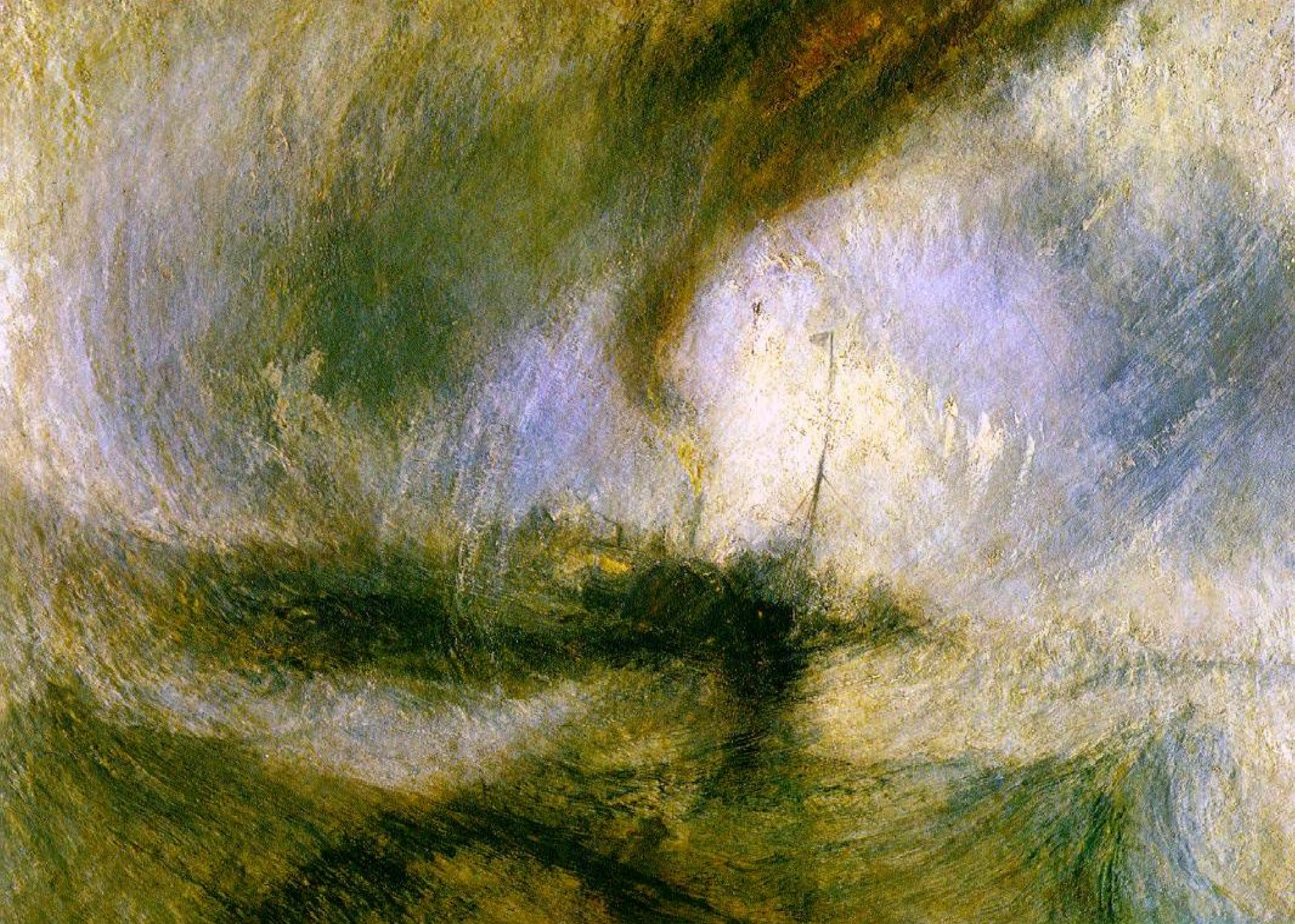
Joseph Mallord William Turner (1775-1851) Snowstorm 1842 Oil on canvas 91.5 x 122 cm. National Gallery, London התמונה מתארת ספינה בלב מערבולת. בהקשר זה כלי השיט יכול להתפרש כסמל למאבק הפטאלי של האדם באיטני הטבע. התמונה בגוונים כחולים שחורים במערבולת של צבע כשהספינה במרכז ותרוניה מוארים בקצף הלבן.