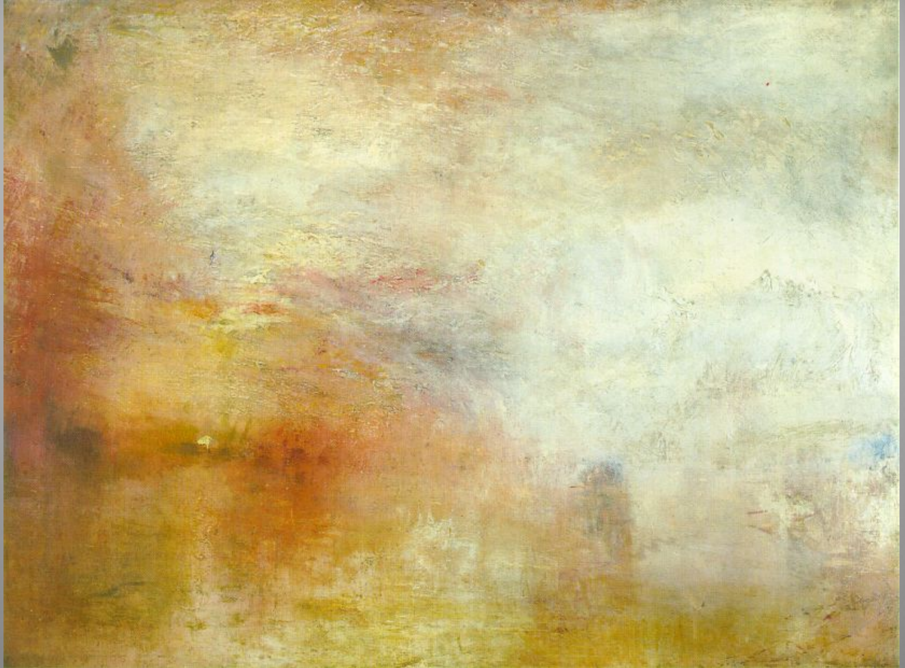
Joseph Mallord William Turner (1775-1851) Sun Setting over a Lake c. 1840 Oil on canvas 91 x 122.5 cm Tate Gallery, London

ברקע מעורפל ונוף לא מזוהה, שקיעת השמש מתוארת בבירור, מאירה את השמים באדום וכתום המשתקפים במים. בצד ימין נדמית צללית של הר.