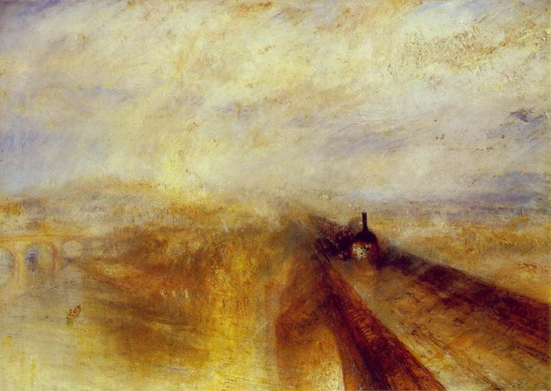
Joseph William Turner (1775-1851) Rain, Steam and Speed 1844 Oil on canvas 90.8 x 121.9 cm. National Gallery, London